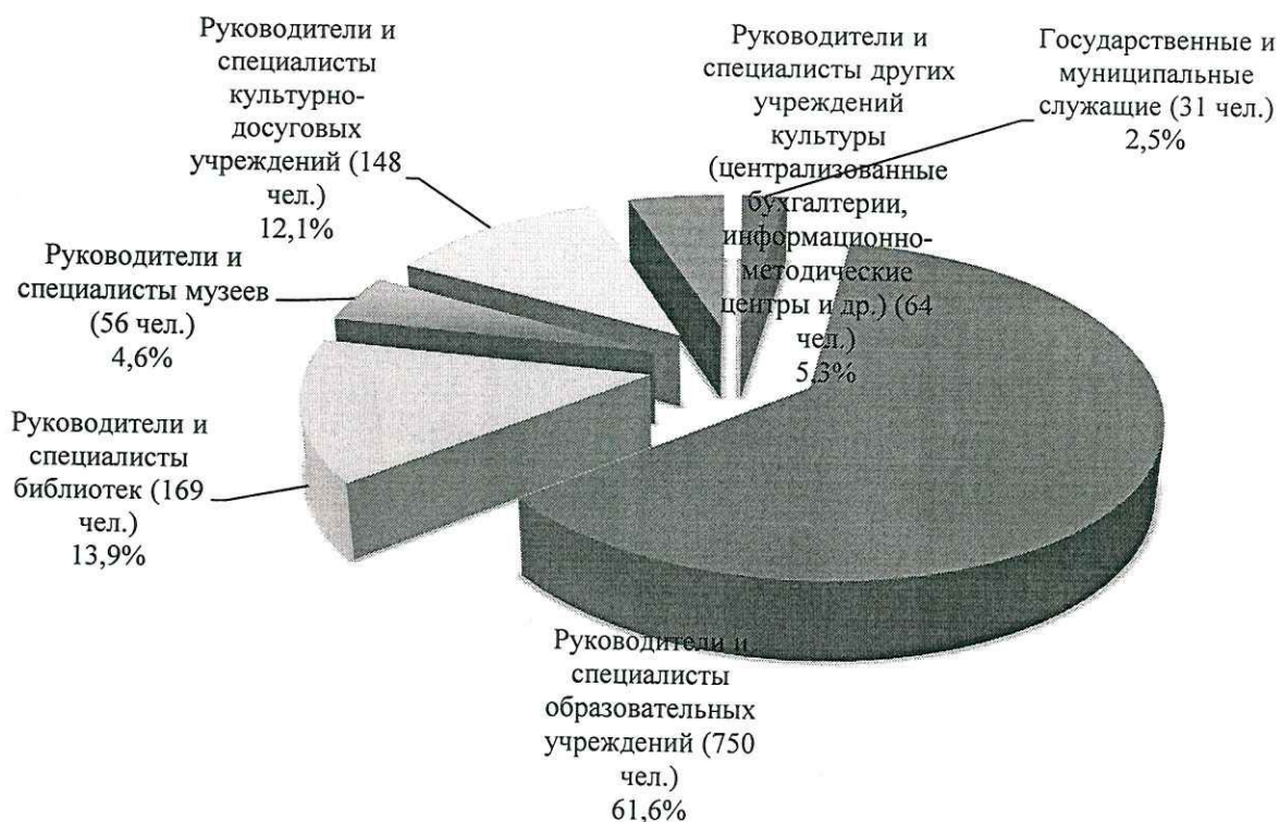
Рис. 2. Количество обученных Центром в 2017 году

За 2017 год в рамках повышения квалификации и профессиональной переподготовки Центром обучен 721 работник сферы культуры Кемеровской области, из них в рамках государственного задания – 238 (профессиональная переподготовка – 17, повышение квалификации - 221), в рамках государственной программы Кемеровской области «Культура Кузбасса» - 99, в рамках внебюджетной деятельности - 384 (табл. 3).