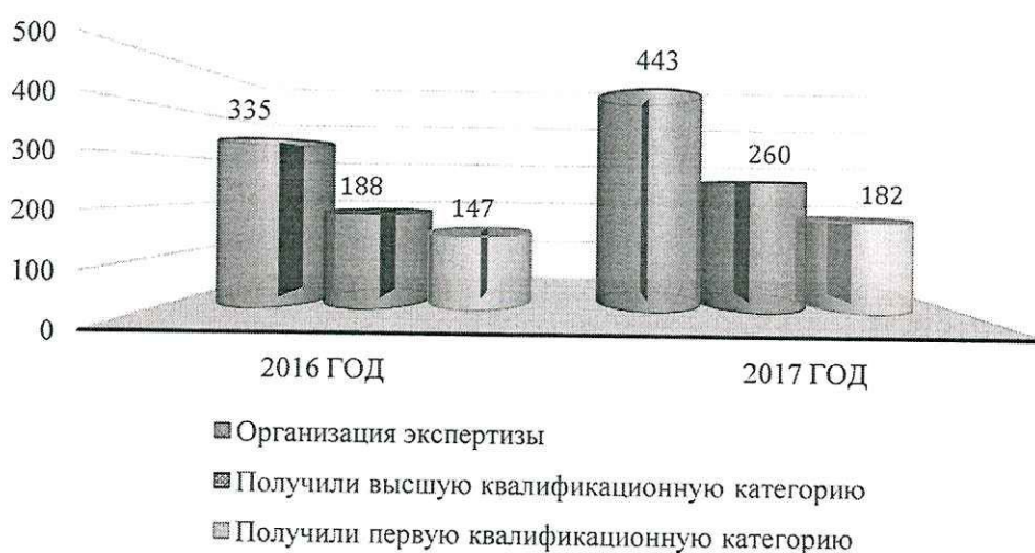
Рис. 5. Аттестация педагогических работников образовательных учреждений культуры в 2017 году

В 2017 году Центром организовано проведение экспертизы профессиональной деятельности 443 педагогических работников образовательных учреждений культуры, претендующих на первую и высшую квалификационную категории. По итогам аттестации в 2017 году 260 педагогических работников учреждений культуры получили высшую квалификационную категорию, 182 – первую квалификационную категорию (рис. 5).