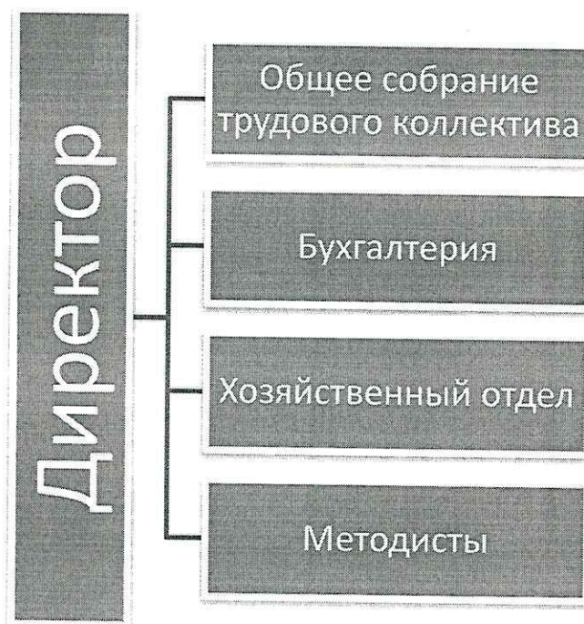
Рис. 1. Структура ГУ ДПО «Кемеровский областной УМЦ культуры и искусства»

Управление ГУ ДПО «Кемеровский областной УМЦ культуры и искусства» осуществляется в соответствии с перечисленными в п. 1 Отчета о самообследовании законодательными и нормативными документами на принципах сочетания единоначалия и коллегиальности (рис. 1).